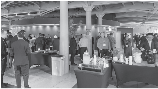
写真2 コーヒーブレイクの様子