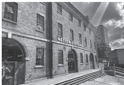
写真 1 会場の Action Stations 外観

初日の口頭発表セッション終了後はウェルカムドリンクが振る舞われ、アルコールを楽しみつつポスター発表を前に和やかに議論している様子が印象深